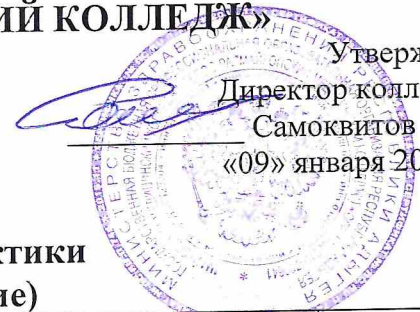
ГРАФИК проведения производственной практики на 2023 – 2024 уч. год (2 полугодие)